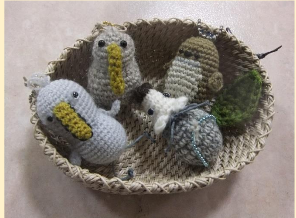
あみぐるみキーホルダー 550円