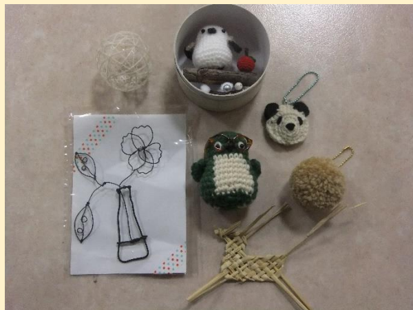
癒しのクラフトいろいろ