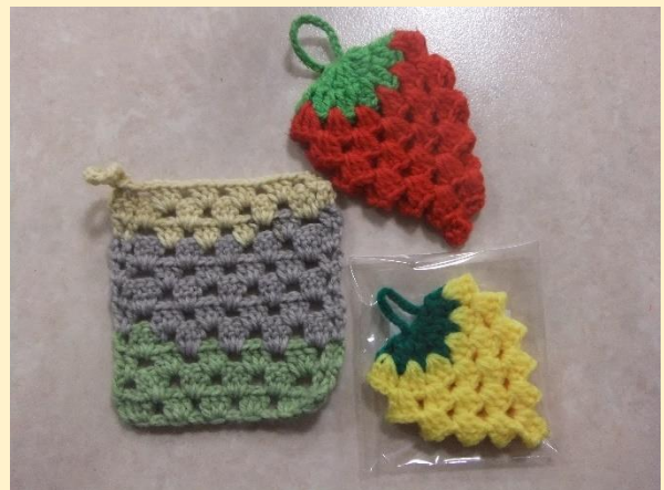
アクリルたわし 110円