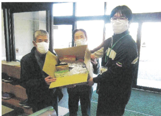
(R5.12 沢地区社会福祉協議会 フードドライブ寄付)