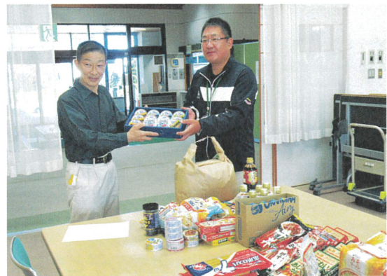
(R5.10 箕輪進修高校様 フードドライブ寄付)

お問い合わせ 箕輪町社会福祉協議会 地域ふれあいグループ TEL: 70-7075