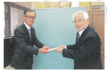
《令和4年度 区長会様》