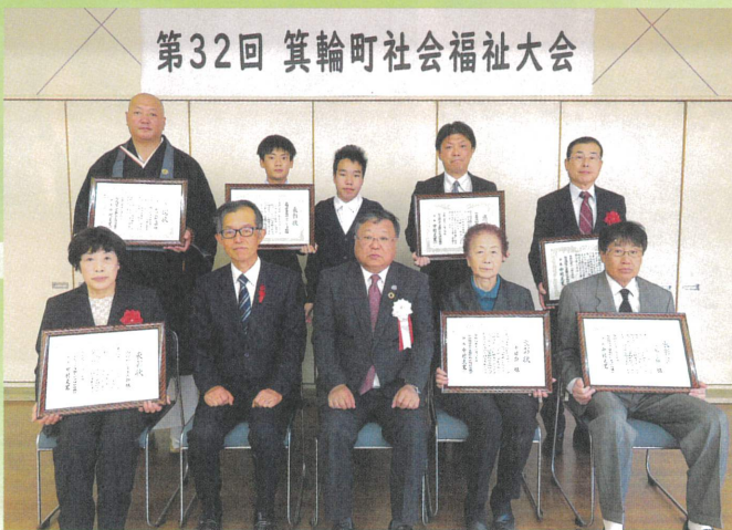
第32回 箕輪町社会福祉大会