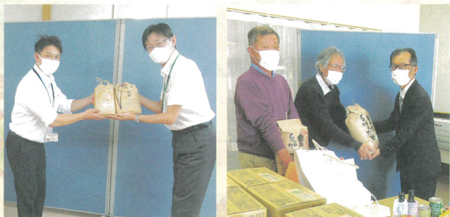
9月19日 東洋羽毛様 11月18日 南小河内区社協様