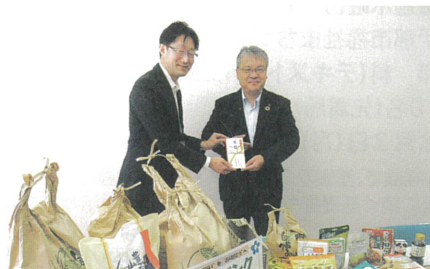
R6.12月10日 アルプス中央信用金庫様