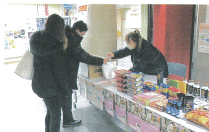
R7.1月17日 商工会新春講演会