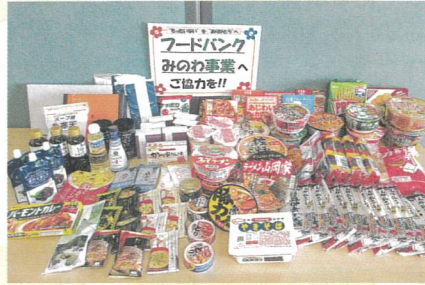
上伊那地区労働者福祉協議会様