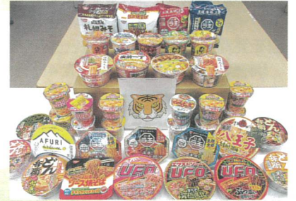
タイガーマスク様(町内・匿名)